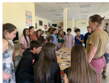
Mise en commun 5 e Bellay