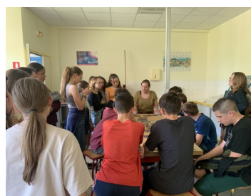
Mise en commun 5 e Pizan

Mme Moreau nous a distribué d'autres cartes à placer pour compléter la fresque. L'objectif était de nous faire comprendre l'impact des activités humaines sur le climat, le cycle de l'eau, les océans, les glaciers et enfin sur les êtres humains.